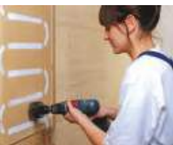
det er muligt at etablere stikdåser i pladerne

Varme kan transporteres på to forskellige måder: ved varmeledning eller ved varmestråling. De klassiske varmesystemer, som gulvarme eller radiatorer, er overvejende varmeledere. Det betyder, at luften opvarmes og cirkuleres ved termisk og konvektion. Konsekvensen heraf er, at støvet hvirvles op og den relative luftfugtighed falder.