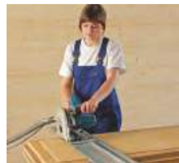
Montering er lige så nem som montering af gipsplader