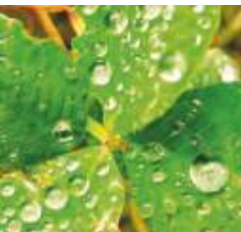
vand – balanceret luftfugtighed

Ler er et 100% økologisk byggemateriale, med perfekte egenskaber til at skabe et godt indeklima