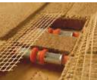
pladernes tilslutninger med klik-koblinger