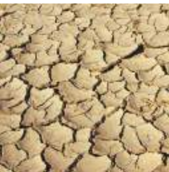
jord – ler som basiselement for en sund bolig