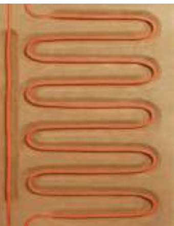
Det indvendige i en naturbo therm mellemlade