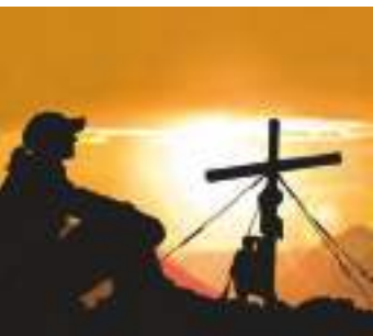
ild – varmekilde vha. af infrarød stråling