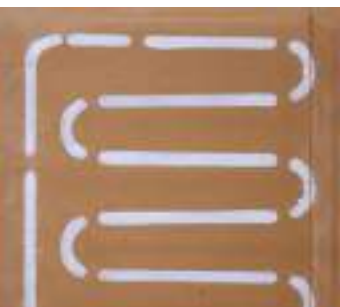
naturbo therm slutplade med markeringer