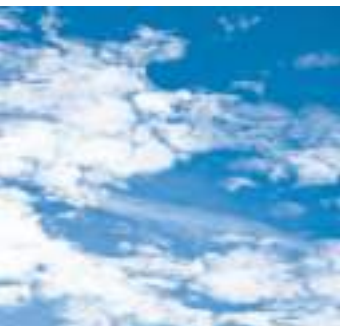
indeklima – rent og friskt, ligesom naturen