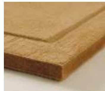
naturbo clima med forsænkede spartelkanter.